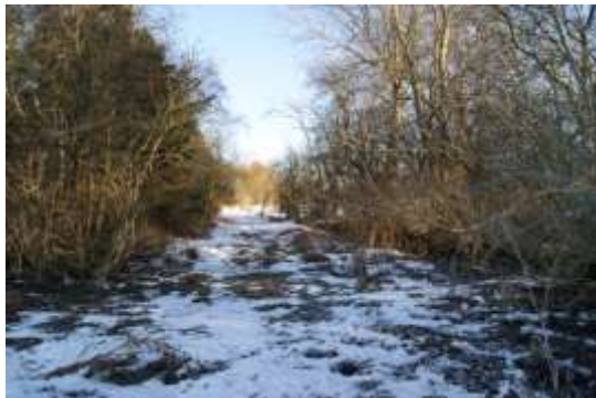
Taastrupsiden er åben og nem at komme frem på.