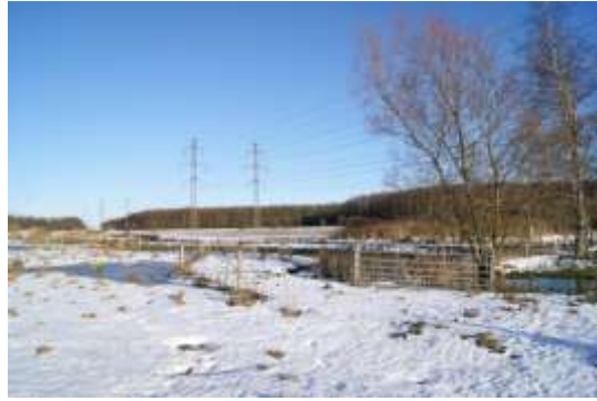
Her skal der igen etableres en stende for at komme over hegnet.