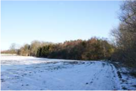
På Taastrupsiden kan stien gå i bræmmen langs åen eller i skelet mellem mark og bræmme.