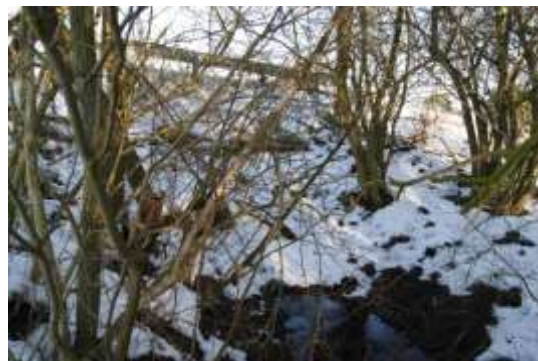
Vadestedet og stenkisten under Snubbekorsvej.