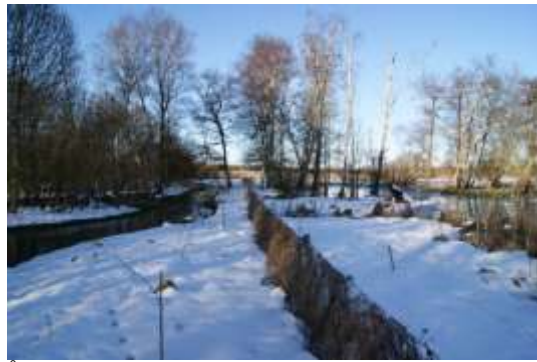
Åen på den ene side og De Våde Enge på den anden.