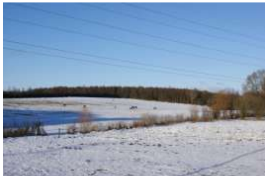
Åbent vue over ådalen fra Snubbekorsvej.