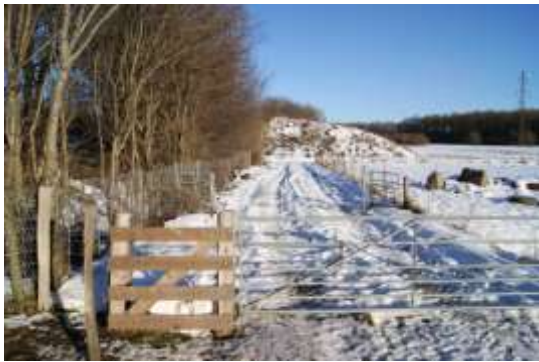
Ud af folden.....