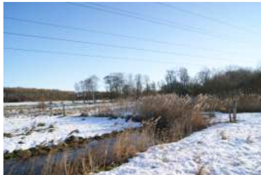
Billedet er taget tilbage mod Roskilde Kro, hvor der skal etableres en spang og en stende.