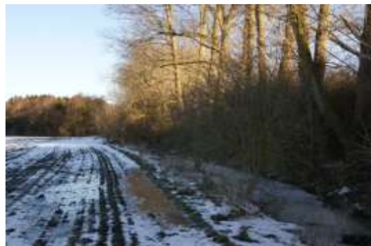
De følgende fotos er alle fra Taastrupsiden, men flere med blik over til Albertslundsidents krat.