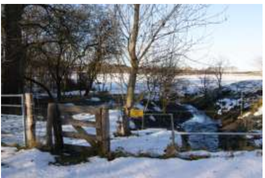
... og ind i næste fold.....