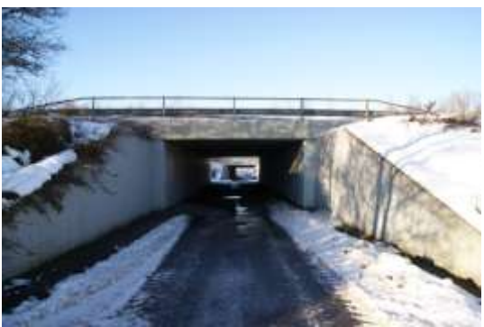
... under motorvejen....