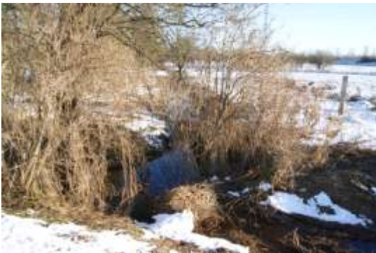
En grøft der skal lægges planke / spang over hvis stien lægges på Albertslundsiden.