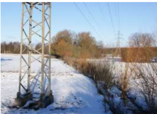
Stien kan senere fortsættes frem til vikingevejen.