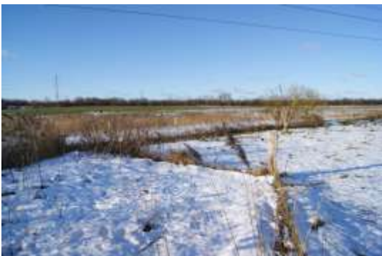
Hvor dyrefolden ender, skal der etableres en stende og umiddelbart efter en spang over åen.