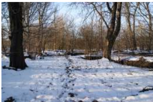
Startstedet ved Roskildekro og så ind gennem skoven.....