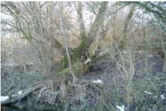
Væltet træ der vokser videre, som stien skal uden om, hvis stien lægges på Albertslundsiden.