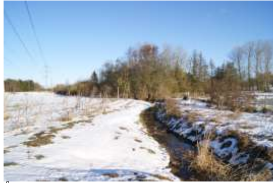
Åbent stykke på begge sider af åen.