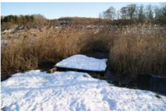
I sivene ligger der allerede en ubrugt spang, som blot skal bugseres på plads.