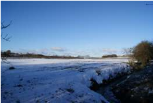
Langs åen med "Landbohøjskolen" til venstre